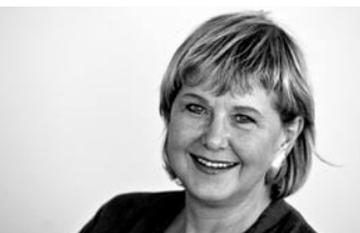
Marianne Birthler, Bundesbeauftragte für die Stasi-Unterlagen

Tag für Tag gehen bei der BStU Hunderte von Anfragen von Menschen ein, die wissen möchten, ob sie vom Staatssicherheitsdienst der DDR bespitzelt und verfolgt wurden – im Jahr 2006 waren es insgesamt rund 96.000 Anträge auf persönliche Akteneinsicht. Angesichts dieser immer noch großen Nachfrage gerät leicht in Vergessenheit, dass gerade der Blick in die »eigene« Akte einst zu den umstrittensten Regelungen im Umgang mit der Hinterlassenschaft des Ministeriums für Staatssicherheit gehörte. Es gab Skeptiker, die Mord und Totschlag prophezeiten und die Einheit gefährdet glaubten, wenn das ganze Ausmaß der Überwachung bekannt würde. Es gab Juristen, die Persönlichkeits- und Datenschutzrechte bedroht sahen. Und es gab diejenigen, die das dunkle Kapitel der jüngsten Vergangenheit möglichst rasch schließen und nach vorne schauen wollten.